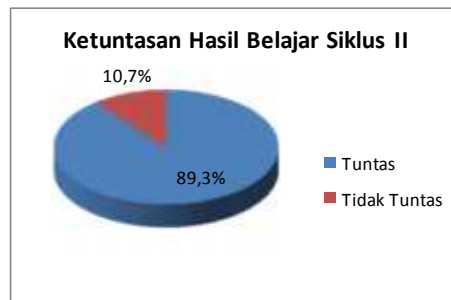
Gambar 3. Diagram Ketuntasan Hasil Belajar Siklus II

Hasil belajar siswa pada siklus II nilai terendah siswa adalah 60 dan nilai tertinggi siswa adalah 90. Rata-rata nilai siswa adalah 76,78. Rata-rata nilai siswa mengalami peningkatan dibandingkan dengan rata-rata nilai siklus I pembelajaran. Peningkatan nilai rata-rata siswa sebanyak 6,07 dari 70,71 menjadi 76,78. Untuk siswa yang tuntas belajar pada siklus II adalah sebanyak 25 siswa (89,3%) sedangkan siswa yang tidak tuntas belajarnya adalah sebanyak 3 siswa (10,7%). Untuk lebih jelasnya dapat dilihat pada diagram berikut.