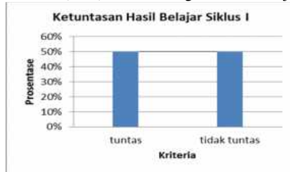
Gambar 2. Diagram Ketuntasan Hasil Belajar Suklus I

Hasil belajar siswa pada siklus I nilai terendah siswa adalah 60 dan nilai tertinggi siswa adalah 90. Rata-rata nilai siswa adalah 71. Rata-rata nilai siswa mengalami peningkatan dibandingkan dengan rata-rata nilai pra siklus pembelajaran. Peningkatan nilai rata-rata siswa sebanyak 6,07 dari 64,64 menjadi 70,71. Untuk siswa yang tuntas belajarnya pada siklus I adalah sebanyak 14 siswa (50%) sedangkan siswa yang tidak tuntas belajarnya adalah sebanyak 14 siswa (50%). Berikut diagram hasil belajar siklus I.